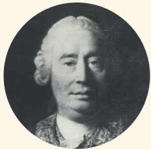
デイヴィッド・ヒューム David Hume. 1711-1776

日本大学図書館法学部分館は、イギリスの哲学者、歴史家、政治・経済思想家として知られる18世紀の巨人デイヴィッド・ヒューム (David Hume, 1711-1776) が、エリバンク卿 (Patrick Murray, fifth Lord Elibank, 1703-1778) に宛てた自筆書簡を11通、また、ヒューム自筆の「領収書」1葉を所蔵している。