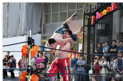
特設リングでの試合風景

普段はプロレスに興味のない方も怖いもの見たさで(笑)。これを機会にプロレスを知ってもらえると嬉しいですし、さらに学生であれば入会を考えると嬉しいのもっと嬉しい。人の数だけ目指せるプロレスのカタチがあり、誰にでもできるスポーツです。何より学祭で目立つことができます。