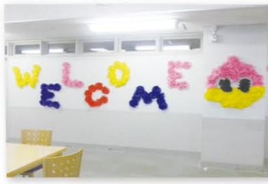
昨年の装飾の様子