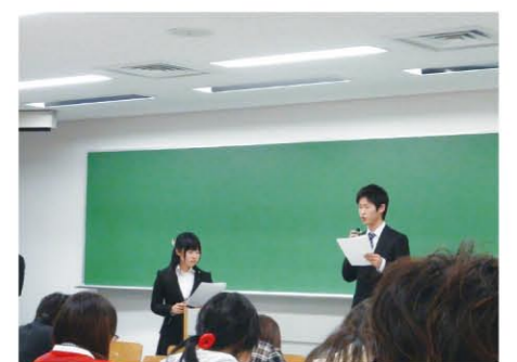
フォーラムの様子