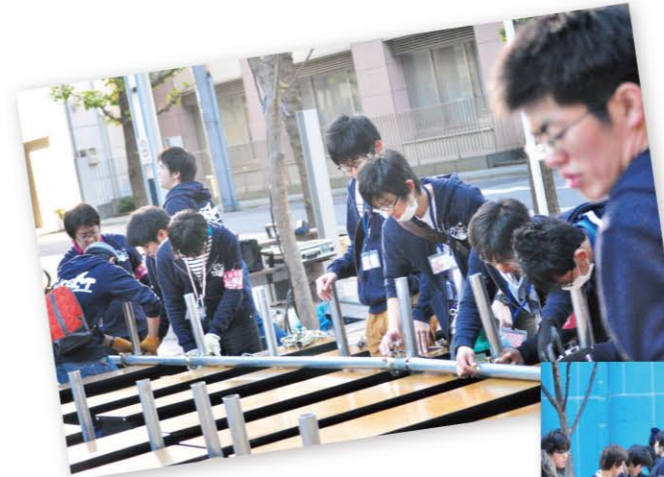
そろいのスタッフジャンパーで屋外の特設リングを設営する委員たち。限られた時間で、「絶対安全」を命題に。

そろいのスタッフジャンパーを着た委員たちが、プロレスの屋外リングを設営する姿は、法桜祭の風物詩のひとつです。いわゆる大道具、小道具の仕事は、実行委員の中から寄せ集めの有志が担当していましたが、去年の第33回から"DIYブロック"委員として専任になりました(P5組織図参照)。それだけ大道具、小道具の安全や精度に力を入れています。メンバーは職人気質の人が多く、たとえば角材の角をきれいに削ってささくれないようにするなど、たかが学祭...と甘んじることなく精度をあげています。今年のDIYブロックには女性が多いので繊細な仕事ぶりにも注目を。