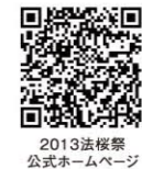
2013法桜祭 公式ホームページ