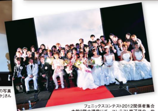
フェニックスコンテスト2012関係者集合 本館3階大講堂にて コンテスト終了後の一枚