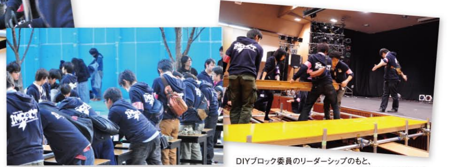
DIYブロック委員のリーダーシップのもと、フェニックスコンテストの華、ランウェイを設営する委員たち。