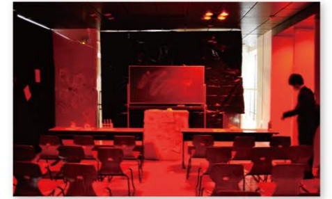
幽霊講堂IV待合室(現2号館1階ロビー) 赤いセロハンで照明を工夫するなど、ゾッとする雰囲気を演出

2011年の東日本大震災の年、ちょうど「幽霊講堂IV」の企画プレゼンの日に震災が起こりました。どうすれば安全に開催できるか、そして教職員を説得できるか。お化け屋敷の通路をつくる3段組みの椅子に滑り止めを付ける、より頑丈な紐で椅子をつなぐなど工夫する一方で、もし余震が起こった場合の避難ルートを確認し、