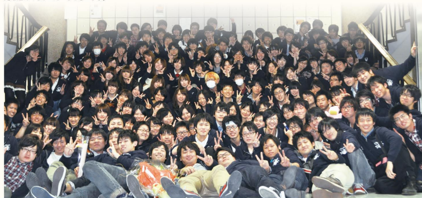
第33回(2012年)法桜祭の実行委員3号館階段前にて、法桜祭全日程終了後の写真