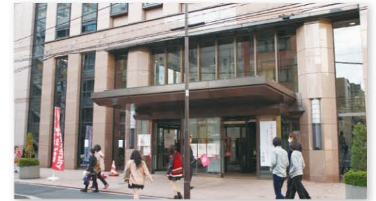
去年の秋のオープンキャンパス 2号館前

法桜祭の行われている3日間のうち、11月2、3日(土、日)には、秋のオープンキャンパスが同時開催されます。在校生のみならず、妹さん、弟さんなど高校生や受験生の知り合いがいらっしゃる方はぜひ一緒にご来場ください。模擬店やおけけ屋敷などの企画だけでなく、法学部ならではのフォーラム発表(ゼミナール研究発表)や模擬裁判などのイベントも行われています。また、法学部が位置する三崎町周辺の地域の方々も来場され、都会でありながら「人情の街」の雰囲気を感じていただけたらと思います。大学の様々な顔を見るチャンスです。