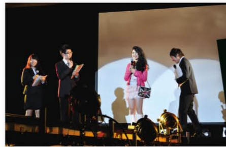
エピソードトーク中の写真 司会は法学部・商学部出身のお笑い芸人「がっつきたいか」さん

ターコンに比べると、学部という小さな規模ではありますが、だからこそコストを抑えながら学生みんなで創り上げるのが魅力だと感じました。グランプリに選ばれて、何かが変わったというわけではありませんが、応援してくれた人のためにも、きちんとしなくては…という意識はいつも持つようになりました。